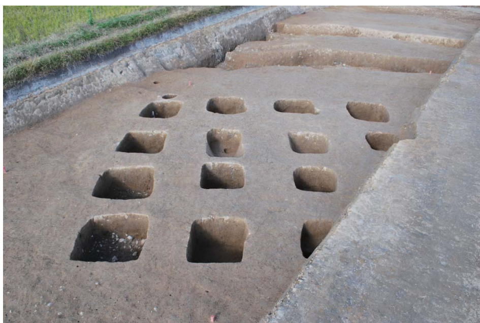
奈良時代の倉庫の柱跡

東海道と隣接していた高野遺跡。古墳時代から人々が住み、居を成していました。出土した遺物が、人々の暮らしを雄弁に物語っています。