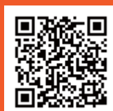
昨年度の体験記事