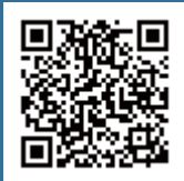
昨年度の体験記事