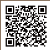
昨年度の体験記事