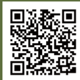
昨年度の体験記事

鹿の骨を使ってかんざしを作ります。形を整え、磨き上げた後に天然素材で染色します。