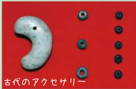
古代のアクセサリー