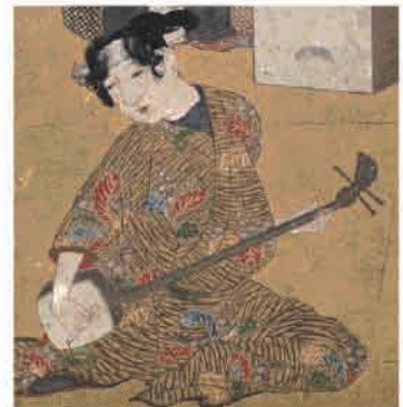
髷を結って三味線を弾く遊女

入れたわけです。禿と対峙して三味線を弾く人物は女性ですが、よく性別を間違われるのは、髷の形を男性のものと思い込んでしまう