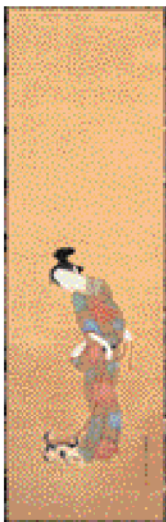
彦根屏風をも とにした画 個人蔵

特に幕末から明治期にかけて多くの作品が確認でき、当時、彦根屏風ブームともいうべき現象がおこったのではないかと想像されます。