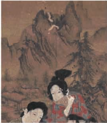
画中画の水墨山水画

遊里の場面は当世風ですが、屏風絵に描かれる水墨山水図は室町期の様式を示し、華やぐ場面に深みを与えています。しかも、その筆はゆるぎなく、水墨山水に相当熟達した画家の存在が想起させられます。