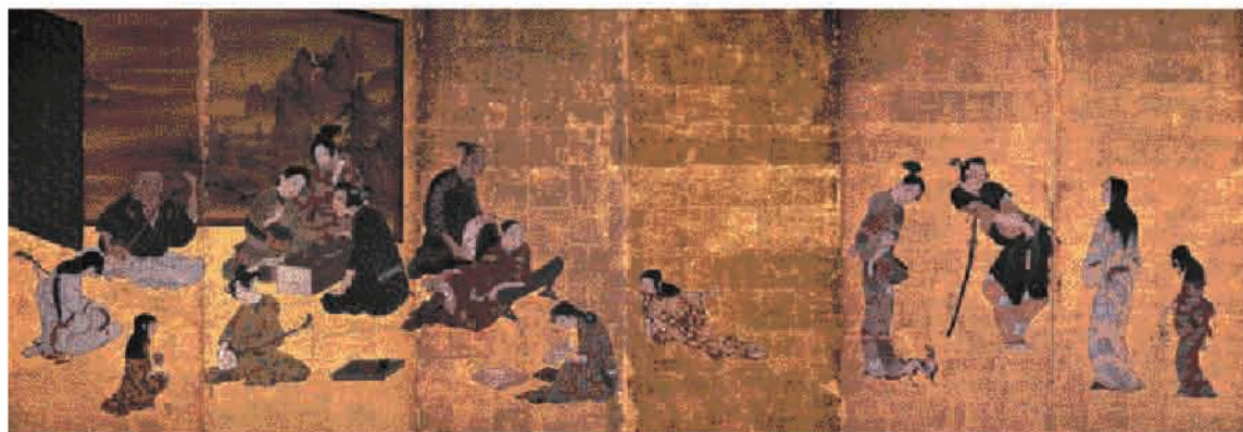
彦根屏風・全図 彦根市蔵

隅の三味線を調弦中の男性は、音楽を生業とする座頭で、遊女に三味線を教授しているようです。脇息にもたれかかる中央の中年女性