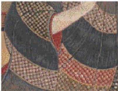
絹の光沢と立体的な絞り文様