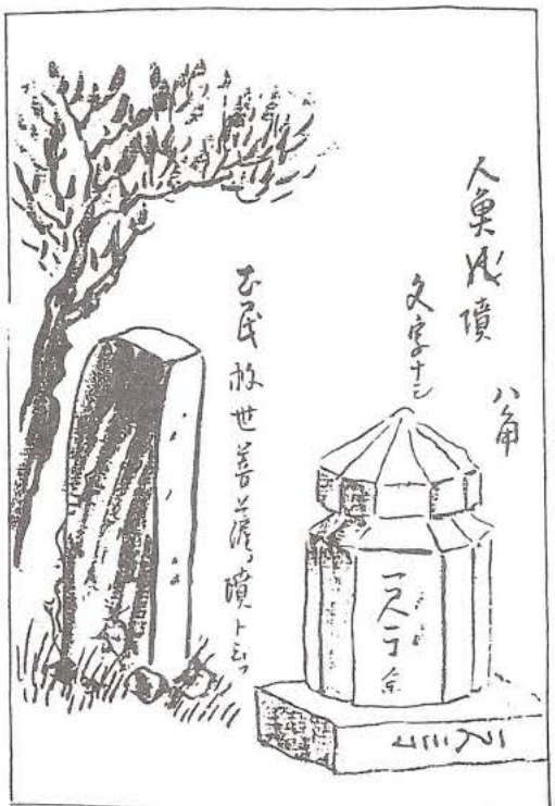
第2図 「江漢西遊日記」のスケッチ