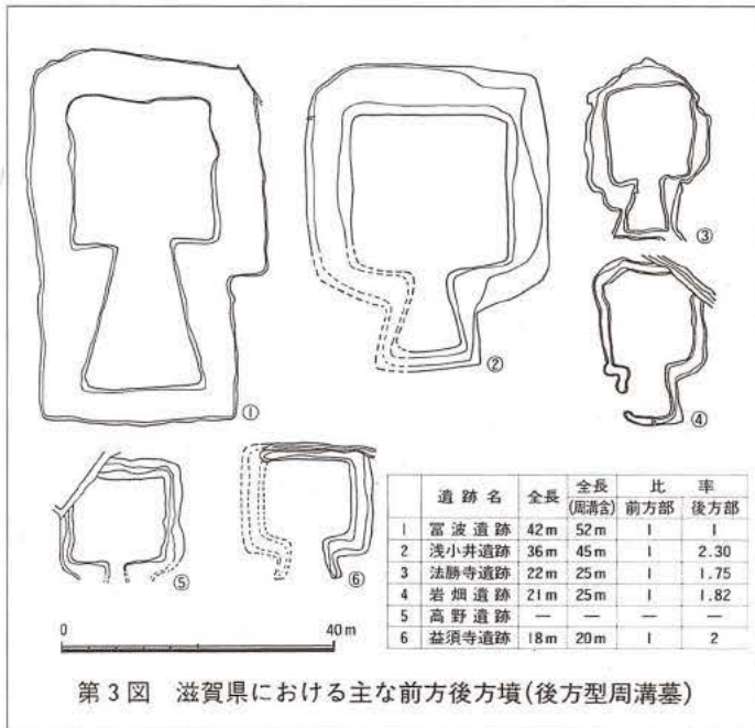
第3図 滋賀県における主な前方後方墳(後方型周溝墓)

以上、富波古墳の位置づけについて若干の考察を試みてきた。当初は前方後方型周溝墓と考えられていたこの古墳も、その後それよりも先行すると思われる前方後方形をした周溝墓の相次ぐ発見や、今回の周溝