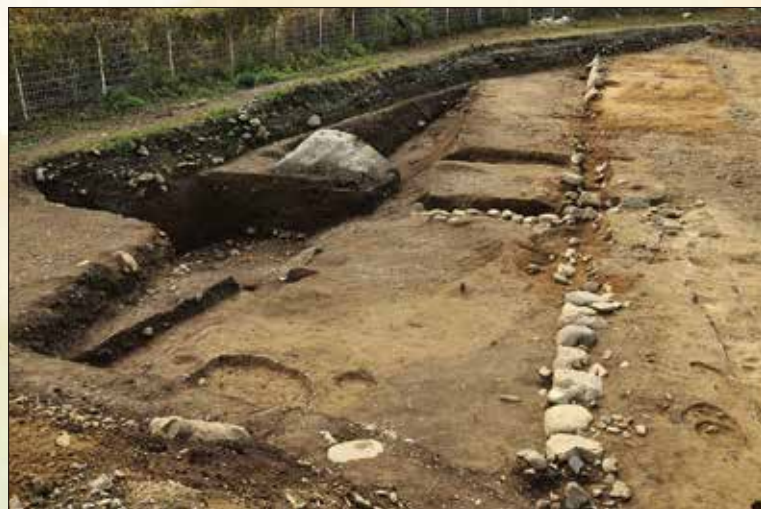
江戸時代の朽木陣屋の石列・道路・堀（朽木陣屋跡）