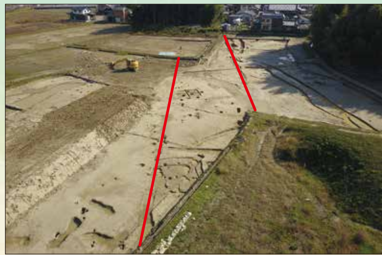
奈良時代～平安時代の幹線道路：東海道（赤線、高野遺跡）