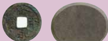
隆平永寶・石帯丸銭（飛鳥時代）