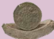
軒丸瓦・軒平瓦（飛鳥時代）