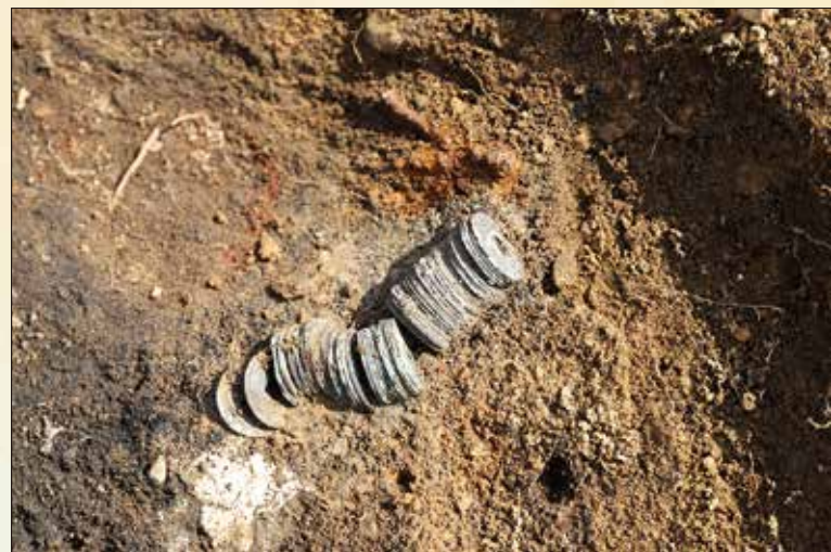
室町時代の火葬墓に納められた渡来銭（大門池南遺跡）

瓦キーホルダーづくりや勾玉づくりのほか、 整理作業の体験もできます。 さらに、発掘調査で見つかったモノを調査員 や大学生がくわしく解説！ 詳細は裏面へ！