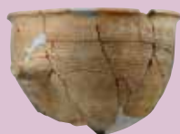
韓式系土器鍋（古墳時代）