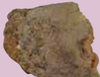
フィゴ羽口（奈良時代～平安時代）