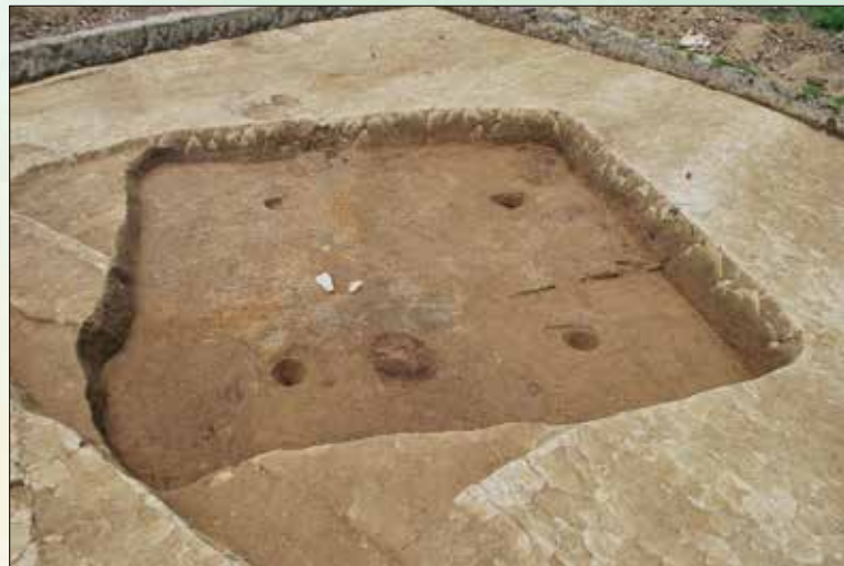
古墳時代の鍛冶をおこなった竪穴建物（出庭遺跡）