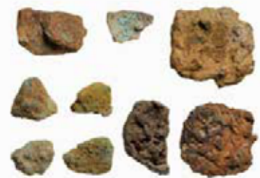
高野遺跡から出土した 銅鉱石・銅滓・鉄滓