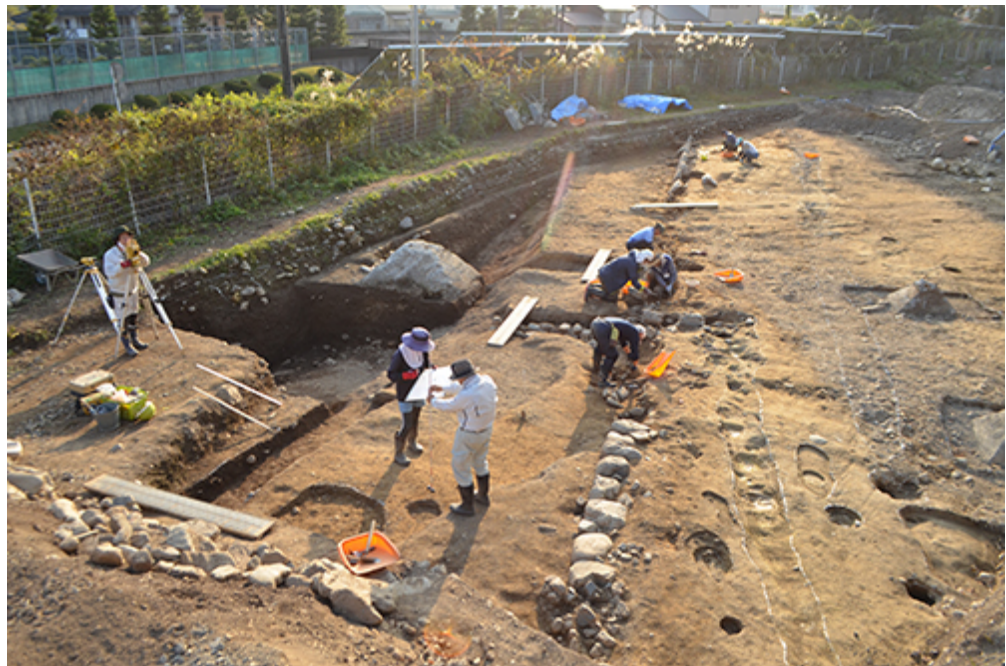
江戸時代（400年～150年前）の登城道と堀

これまでに行なわれてきた発掘調査により、江戸時代に朽木陣屋が置かれた場所にあったとされる幻の朽木城の一端が、垣間見えてきました。