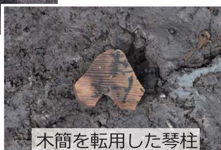
木筒を転用した琴柱

古代の川跡から多量の土器や木製品が出土した上砥山遺跡。なかには、文字の記されたものや祭祀に用いられたものもあり、川縁での営みの一端を垣間見ることができ ます。