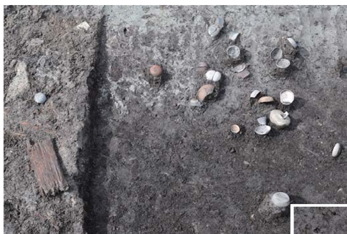
川跡から出土した土器