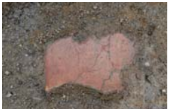
河道1から出土した縄文土器