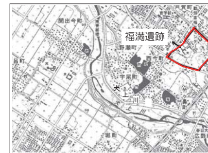
福満遺跡周辺地図