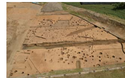
様々な時代の建物跡や川の跡が発見されました