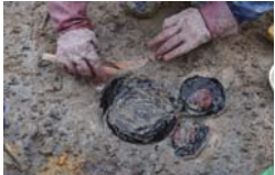
溝3から出土した平安時代の漆器