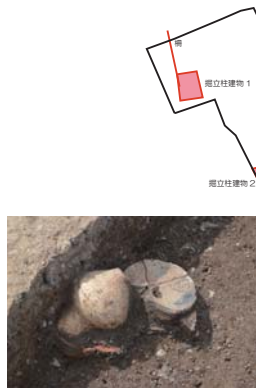
竪穴住居1から出土した弥生土器