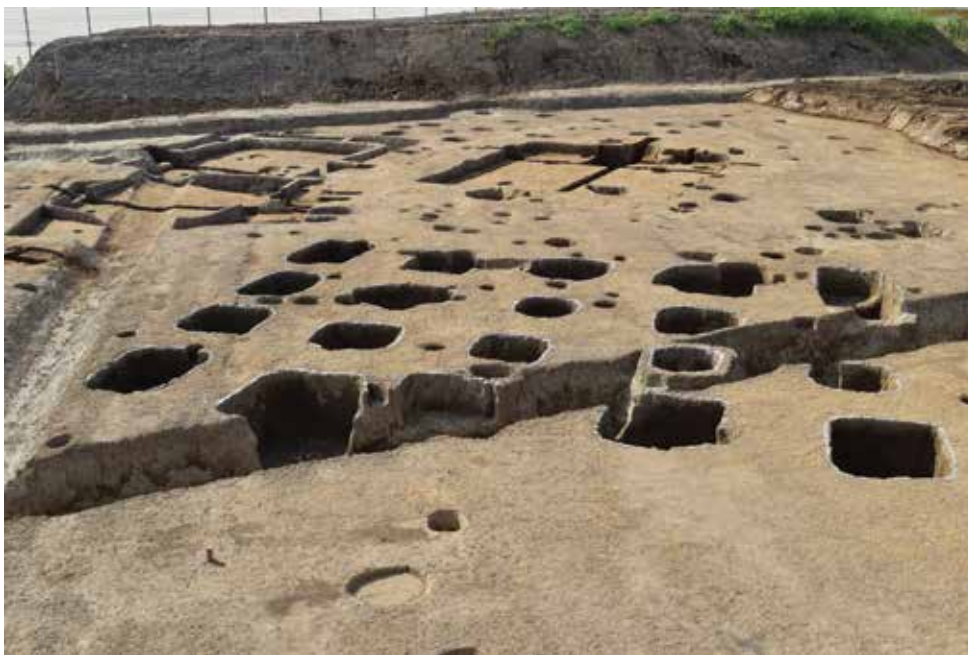
奈良時代の倉庫の柱跡

奈良時代、物資の集積地だった福満遺跡では、すでに縄文時代から人々が暮らしていました。出土した各時代の器は、この地で連綿と続く生活の営みを私たちに伝えていきます。