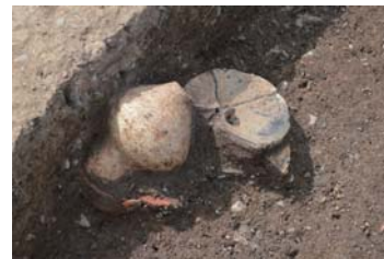
竪穴住居1出土の土器