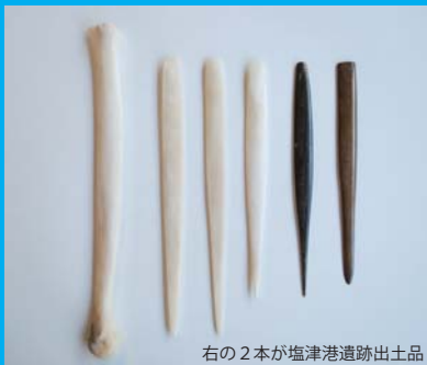
右の2本が塩津港遺跡出土品

鹿の脚の骨をつかって、骨角器をつくりま。意外と鹿の骨が固くて苦戦しそう。着色もして磨き上げれば立派な装飾品。出土品に負けないものをつくりあげよう!