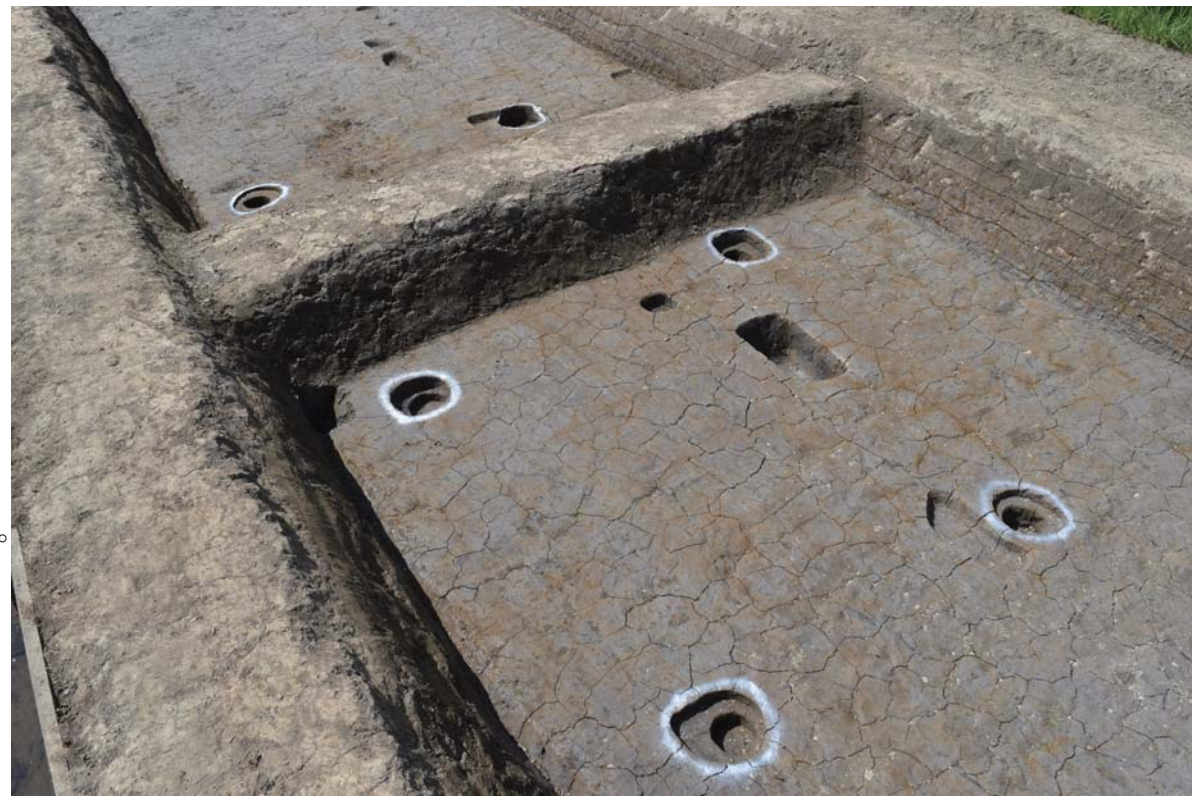
建物。調査区の外へ続いているようです。