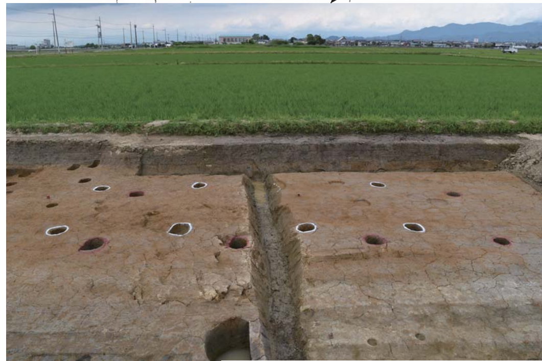
建物。2棟の建物が重複して見つかりました。