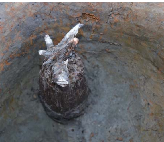
建物には柱根が残っているものもありました。