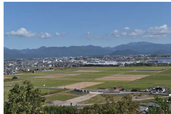
(山崎山から調査地をのぞむ)

公益財団法人滋賀県文化財保護協会 Shiga Prefectural Association for Cultural Heritages