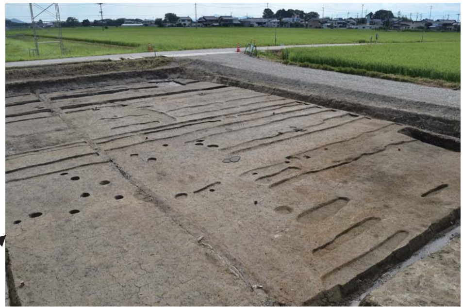
耕作痕。細長い溝が複数並んでいます。