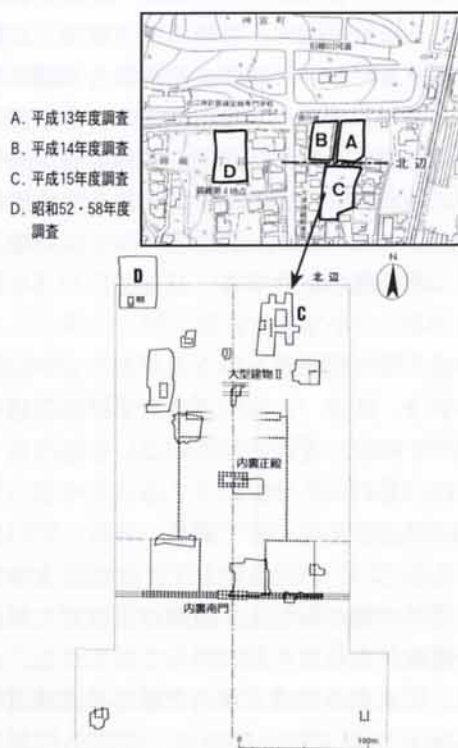
図2 平成13～15年度発掘調査地点

ただ、問題が少し残っています。それは、今回の調査地点西側のD地点で行った発掘調査で、予想された内裏の北を限る遺構が見つからなかったのです(大津宮に関わる遺構は倉と見られる建物跡が南端部分から見つかっただけ)。ただ、同地点は第二次世界大戦直後に変電所が造られたといわれており、その