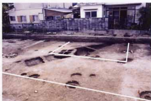
C地点で見つかった建物跡

ここ数年、大津宮に関する新しい遺構の発見はなかったのですが、平成13～15年度にかけて、「大型建物跡Ⅱ」の北東側一帯で3カ所の発掘調査が続けて行われ、大津宮の範囲を考える上での大きな成果がありました。