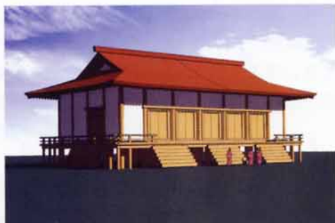
内裏正殿復原図(大上直樹氏作図)

大津宮が詳しく載る史料としては、『日本書紀』があげられます。天智6年(667)3月、近江に都を遷し、壬申の乱があった天武元年(672)7月までの5年半余りの間に、宮の状況がある程度理解できる記述がいくつかあり、それを見ていくと、大津宮には、①「 おほうち 内裏」、②「 はまのうてな 濱臺」、③「 おほくら 大蔵」、④「 みや 宮門」、⑤「 みあらか 殿」、⑥「 ろこく 漏剌」、⑦「 にしのごあんどの 西小殿」、⑧「 おほりだのみや 内裏佛殿」、⑨「 にしのごあんどの 内裏西殿」、⑩「 おほくら 大蔵省第三倉」、⑪「 おほひのつかさ 大炊」、⑫「 おほとの 大殿」といった施設や建物があったようです。(①~⑫のふりがなは日本古典文学大系『日本書紀<下>』-岩波書