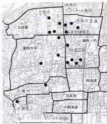
図3 大津宮遺構検出地点及び小字図

なぜ、気になるかという点、この2つ以外の小字は、県道（これが大津宮中核部の建物配置の中軸線と考えられている）を境にして東と西にきれいに分かれているのですが、ここだけ県道をまたぐ形で細長く存在しています。そして、これを境にして、北側に大津宮中核部の建物が集中し、南側からは宮に関連する建物がまったく見つかりません。さらに、E地点からは、東西に延びる溝跡（幅約1.3m）が見つかり、先にあげた2つの小字のちょうど真西にあたっています。