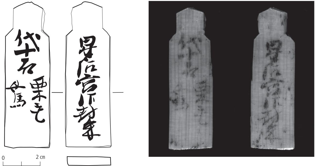
図2 塩津港遺跡 出土木簡(1)

との荷物を運送するための、陸路と湖上路との転換点であった。『延喜式』主税上「諸国運漕雑物功賃」には若狭を除く北陸6国の物資は敦賀から塩津を経由し大津から京へ運送する駄賃や船賃、物資を保管するための屋賃が記されている。米などの貢納物を船で輸送するためには大規模な港湾施設は不可欠であるが、古代の港の位置はこれまで明確ではなかった。